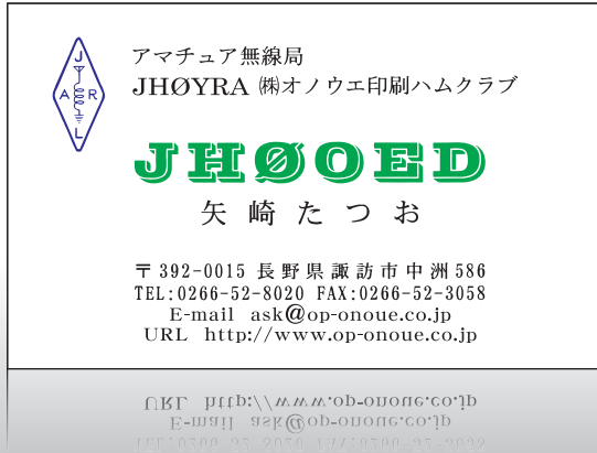
カラーアマチュア無線名刺 (パターン①を用いた見本)