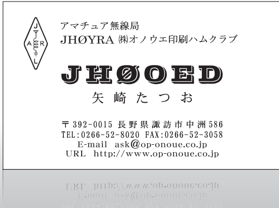
モノクロアマチュア無線名刺 (パターン①を用いた見本)